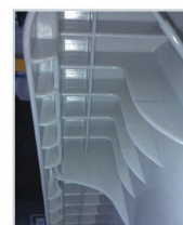
attacco a pettine con sistema a molla