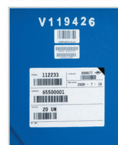
incisioni / etichettazioni