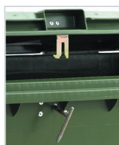
serratura jco chiave triangolare