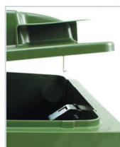
serratura a gravità centrale