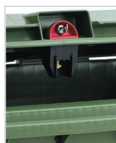
serratura a gravità modello sudhaus