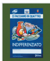
marcatura IML termoimpresa