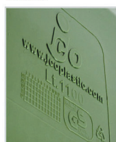
marcatura a rilievo